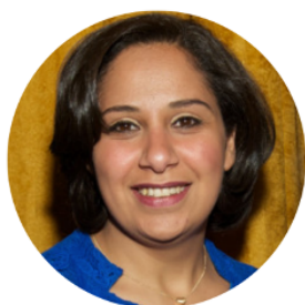
MOZN HASSAN FEMINISTA EGIPCIA Y DEFENSORA DE DERECHOS HUMANOS